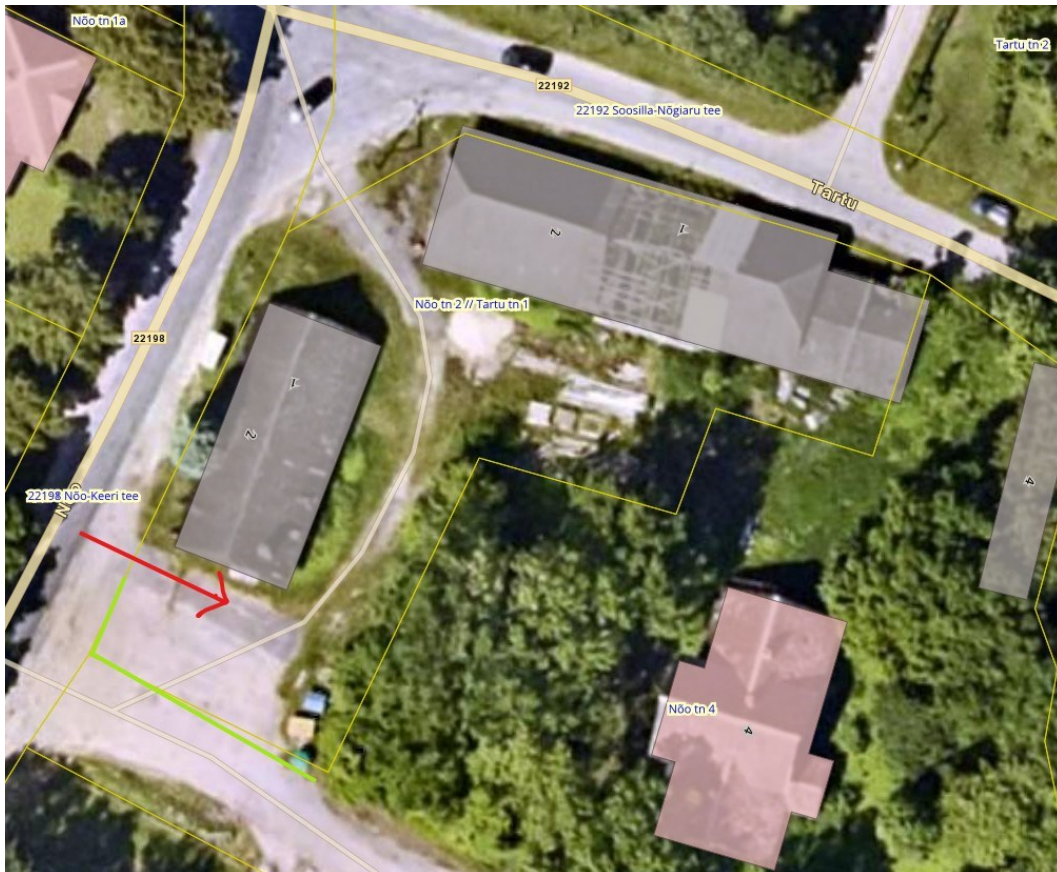
Joonis 1. Juurdepääs riigitee nr 22198 km 2,96 (punasega) ning piire (rohelisega), väljavõte Maa- ja Ruumiameti geoportaalist